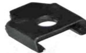
задвижка боевой пружины