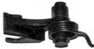
шептало с пружиной